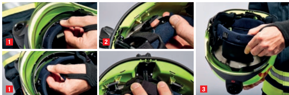
1: Upevňovací body přední 2: Upevňovací body zadní

Nastavení výšky nad temenem se provádí nejsnadněji s vyjmutým náhlavním systémem.