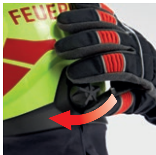
Nastavovací prvek velikosti musí být otočený do „minimální“ polohy.